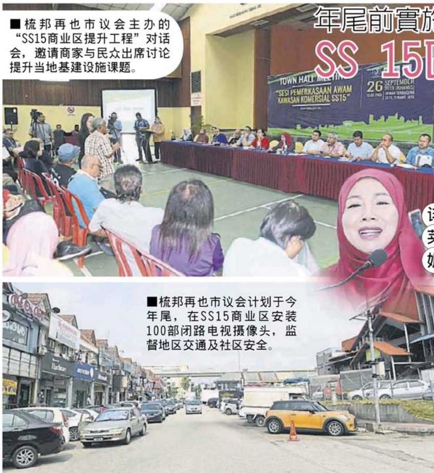
■ 梳邦再也市议会主办的“SS15商业区提升工程”对话会，邀请商家与民众出席讨论提升当地基础设施课题。