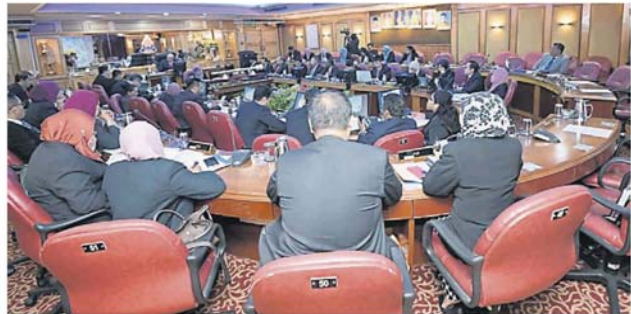
灵市政厅召开常月会议, 商讨各项民生问题和决策。

“我也建议市政厅召集三造开会, 要他们汇报清理进展、已遴选的承包商等, 并有系统地进行监督、划分职务, 甚至要三造或涉及的政府机构安排一个联络人, 方便居民或市议员跟进清理进展。”