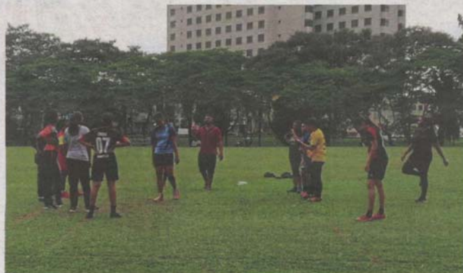
Sepang Kabaddi Association players currently train at a football field in Jalan ST 1/2.

"We also hope that the court will be fitted with a mat and roof so that we can train regardless of the weather," she said.