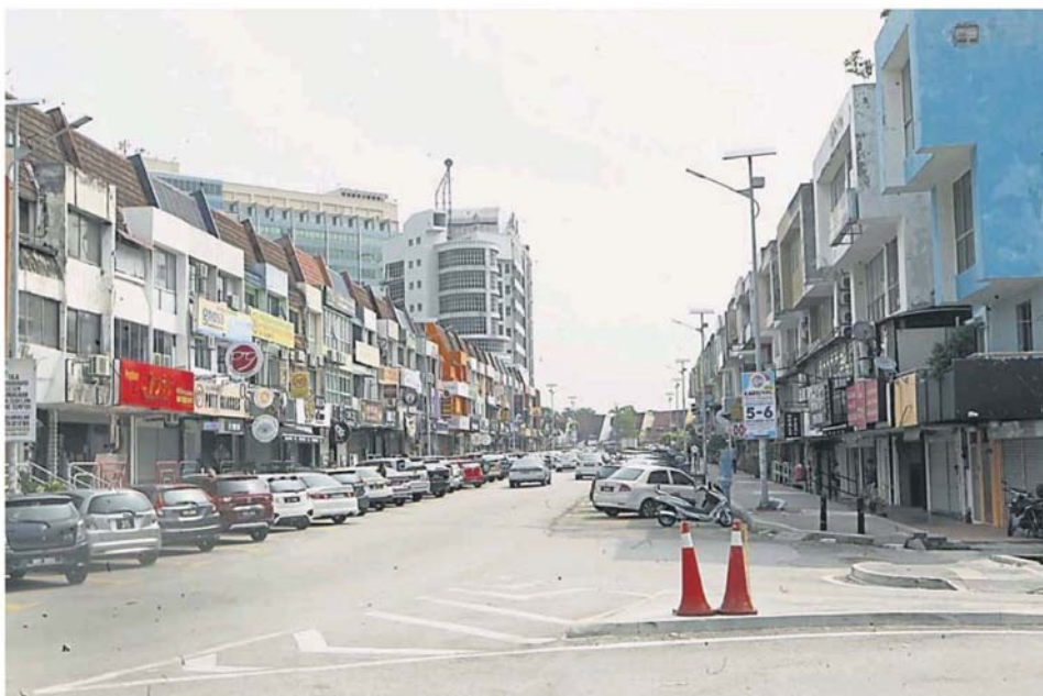
市议会将会改善人行道。

梳邦再也 SS15 商业区占地 161.8 公顷，高业区是高密度及有高楼混合发展区，拥有 1116 间住宅、3 间大学或学院、2 所私人及宗教学校，以及 595 间商业地段。