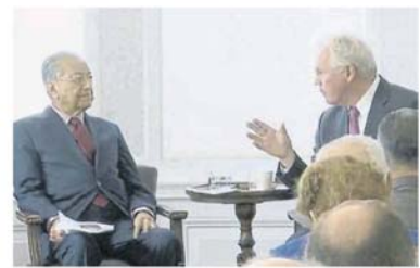
■马哈迪(左)出席外交关系会议时，指会在下届大选前辞去首相一职。