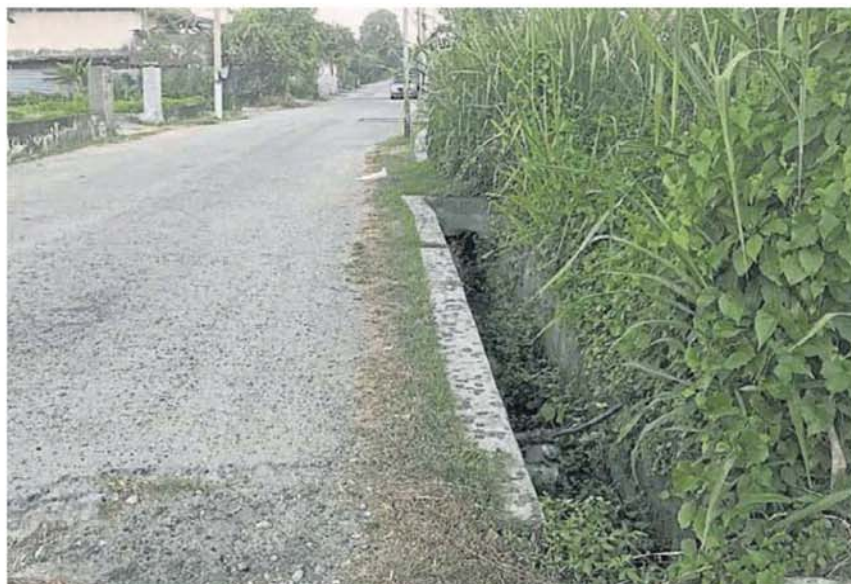
■万宜国会议员的拨款将用来提升1/10路的排水沟。