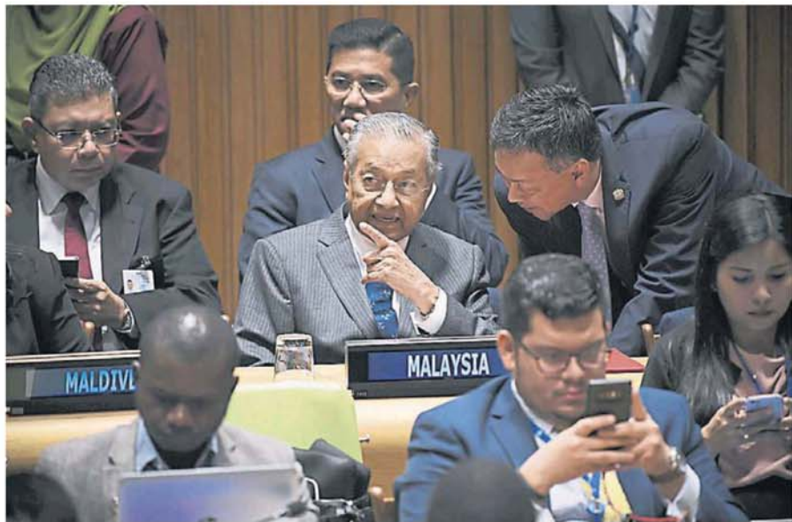
马哈迪与官员交流，后左起为赛夫丁与阿兹敏。