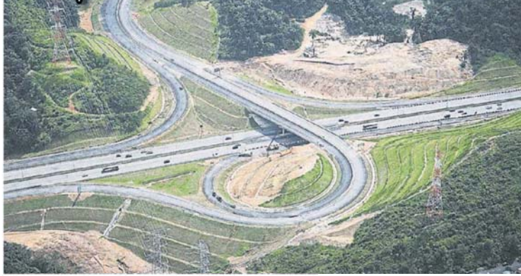
■隆布大道是其中一条贯穿梳邦再也市议会辖区的大道。