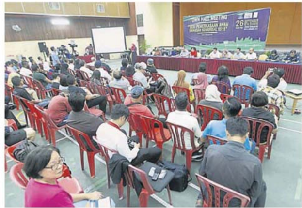
商民积极出席会议，提出对改善工程的看法。

为例，指该区自取消路边停车位的月票服务，强制当地员工把轿车停放在多层停车场后，据商家回应感到此举可行，有更多路边停车位吸引消费者到来。